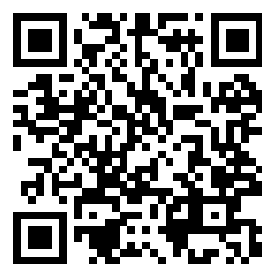
本会ホームページQRコード