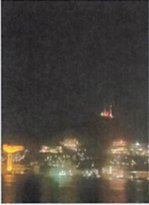
長崎市稲佐山電波塔

◆下記開催地のご支援により、オレンジライトアップ(認知症の普及啓発のシンボルカラー)を行います