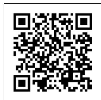
本会ホームページQRコード